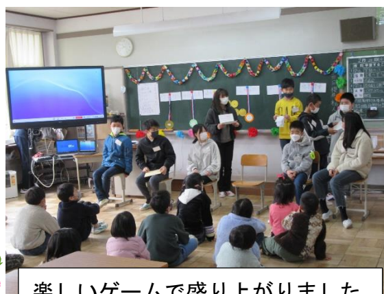
楽しいゲームで盛り上がりました