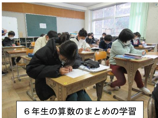
6年生の算数のまとめの学習

今月の3月17日には修了式、卒業式が行われます。今年度も残りわずかとなりました。子供たちは、各学年の学習のまとめに取り組んでいます。各学年の学習内容をきっちりと身に付けて進級・進学できるよう、教職員一同全力で指導・支援にあたりますので、保護者の皆様のご協力をお願いします。