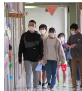
各教室へ移動します