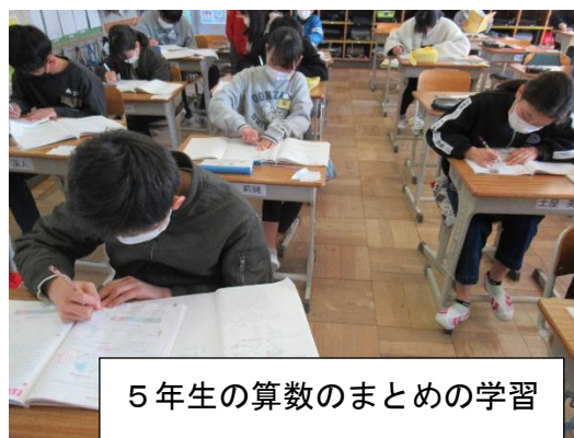
5年生の算数のまとめの学習