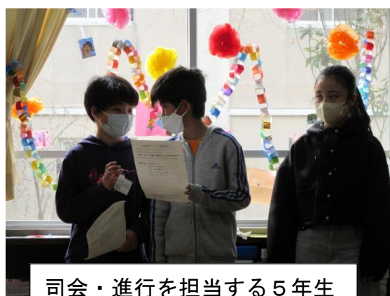
司会・進行を担当する5年生