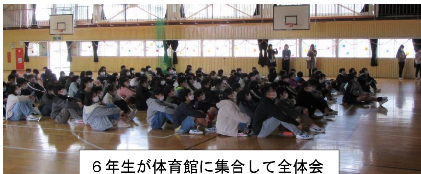
6年生が体育館に集合して全体会

2月24日（金）に「6年生を送る会」が行われました。新型コロナウイルス感染防止のため、6年生と5年生の実行委員が体育館に集合し、全体会を行いました。その後、6年生はたてわり班の教室に移動し、班ごと、5年生のリーダーを中心に会を進めました。その様子を紹介します。