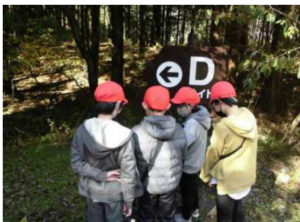
【フォトオリエンテーリング】

11月19日（金）に富士宮市の朝霧高原にて自然教室が行われました。朝霧野外活動センターでは、フォトオリエンテーリングを行いました。雄大な富士山を仰ぎ見ながら、友達と協力してゴールを目指しました。松下牧場では、乳搾りや牛舎の清掃、バター作りを行いました。初めての体験に戸惑いながらも、夢中になって活動し、酪農体験を満喫しました。