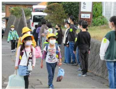
【児童会あいさつ運動】