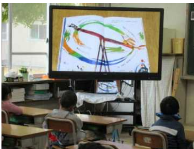
【図書館書露木先生による読み聞かせ放送】